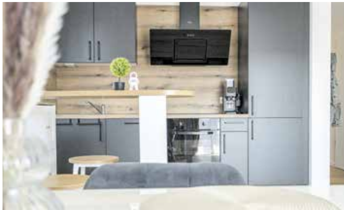
Alle Wohnungen sind mit einer Küche ausgestattet.

Bereits im September diesen Jahres zogen die ersten Mieter im