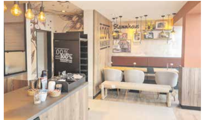
Nach einigen Wochen Umbauzeit wurde das Stammhaus in Remels wieder eröffnet.

Na mennig Weken Renoverungsarbeiten wurr dat Stammhuus van 1950 van de Backeree Hoppmann KG heel modeern umboot un groter maakt. Weer openmaakt wurr de Filiale an de Oortsingang van Remels in d' September. An de eerste Dagen gaff dat vööl Angeboden.