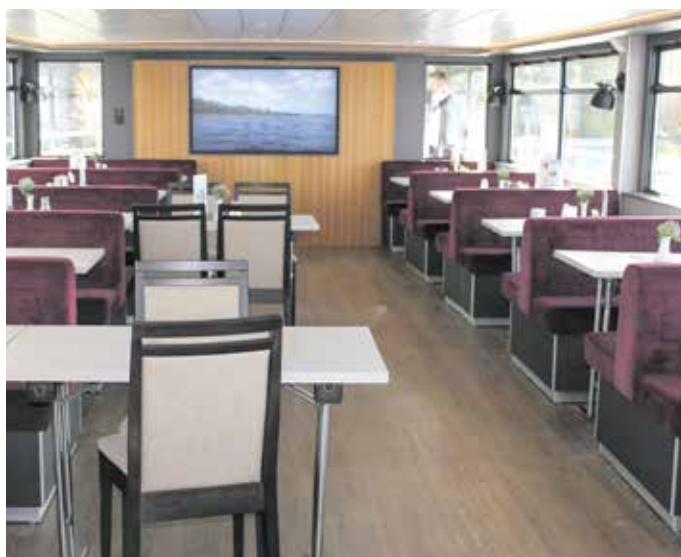
Im oberen Salon gibt es jetzt eine digitale Werbetafel mit weiteren Außenplätzen.

Mehr Informationen zum Winterfahrplan und den Sonderfahrten im Internet unter www.weisse-flotte-zwischenahn.de .