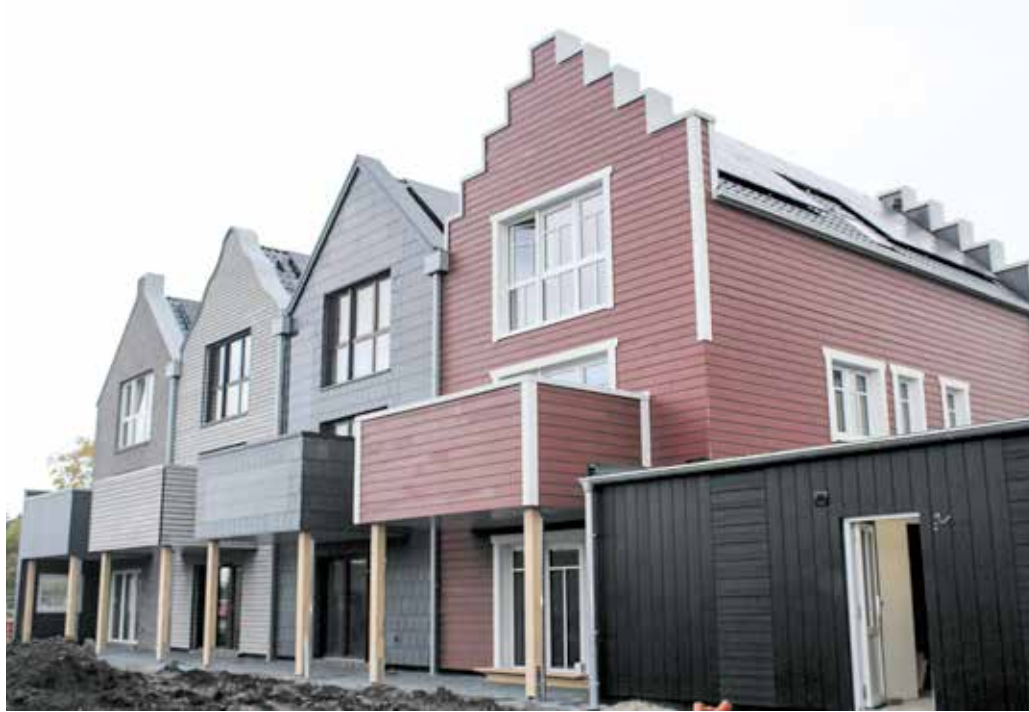
Das Neubauprojekt der Zimmerei Peter Stock entsteht in der Ortsmitte von Apen.