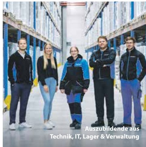
Auszubildende aus Technik, IT, Lager & Verwaltung